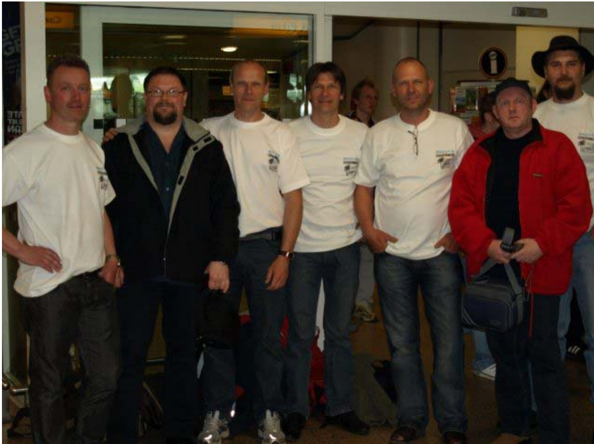
ON6CC, MM0GHM, ON4ATW, ON4HIL, ON4IA, MM3DHL en ON5TN.

Woensdag 6 mei vertrok dan de laatste groep richting België. Het was een vermoeiende maar leerrijke trip geweest voor ons allen. We hebben veel geleerd van deze trip en misschien zal hieruit nieuwe energie ontstaan om een tweede trip naar Rockall te ondernemen. We zoeken daarvoor koortsachtig naar sponsoring, want het blijft een financieel risico voor de teamleden. We willen de volgende keer dan ook zeker zijn dat we slagen in onze opzet, voor onze sponsors en mederadioamateurs. Wil je ons sponsoren, mail ons dan via info@rockall.be . Foto's en verdere informatie kan je terugvinden op www.rockall.be .