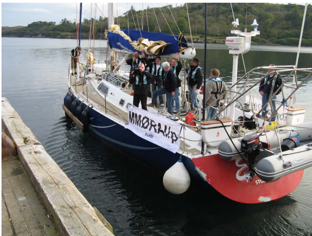
De Elinca vertrekt richting Rockall vanuit de haven van Stornoway (Schotland)

Onze verticale antenne werd op het achterdek gemonteerd met een ICOM-tuner en met één radiaal verbonden met het metalen hek van de Elinca. De tuner werkte van 80m tot en met 10m. Rond vier uur 's middags vertrokken we richting Rockall. Omdat de Elinca geen automatische piloot had, moesten er twee personen permanent op het dek blijven. Intussen werden er dikke pile-ups gedraaid met QSO over heel de wereld. Regelmatig werd de stand van zaken medegedeeld en werd er gretig gecommuniceerd met het thuisfront. Als het station niet voor QSO gebruikt werd, stuurde men de coördinaten door via Winlink, zodat iedereen kon zien waar wij ons