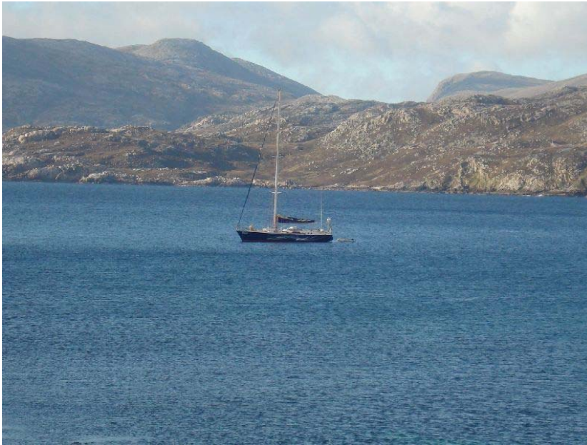
De Elinca voor anker in een van de talrijke baaien van Lewis Island.

afblazen er zijn teruggereden naar Leverburgh. Daar zaten we dan, wachtend op de storm die nog zou komen. 's Avonds werd er nog wat gefeest met live vioolmuziek van John en met wijn en zalm. Dat krikte het moreel wat op. 's Morgens brak de hel