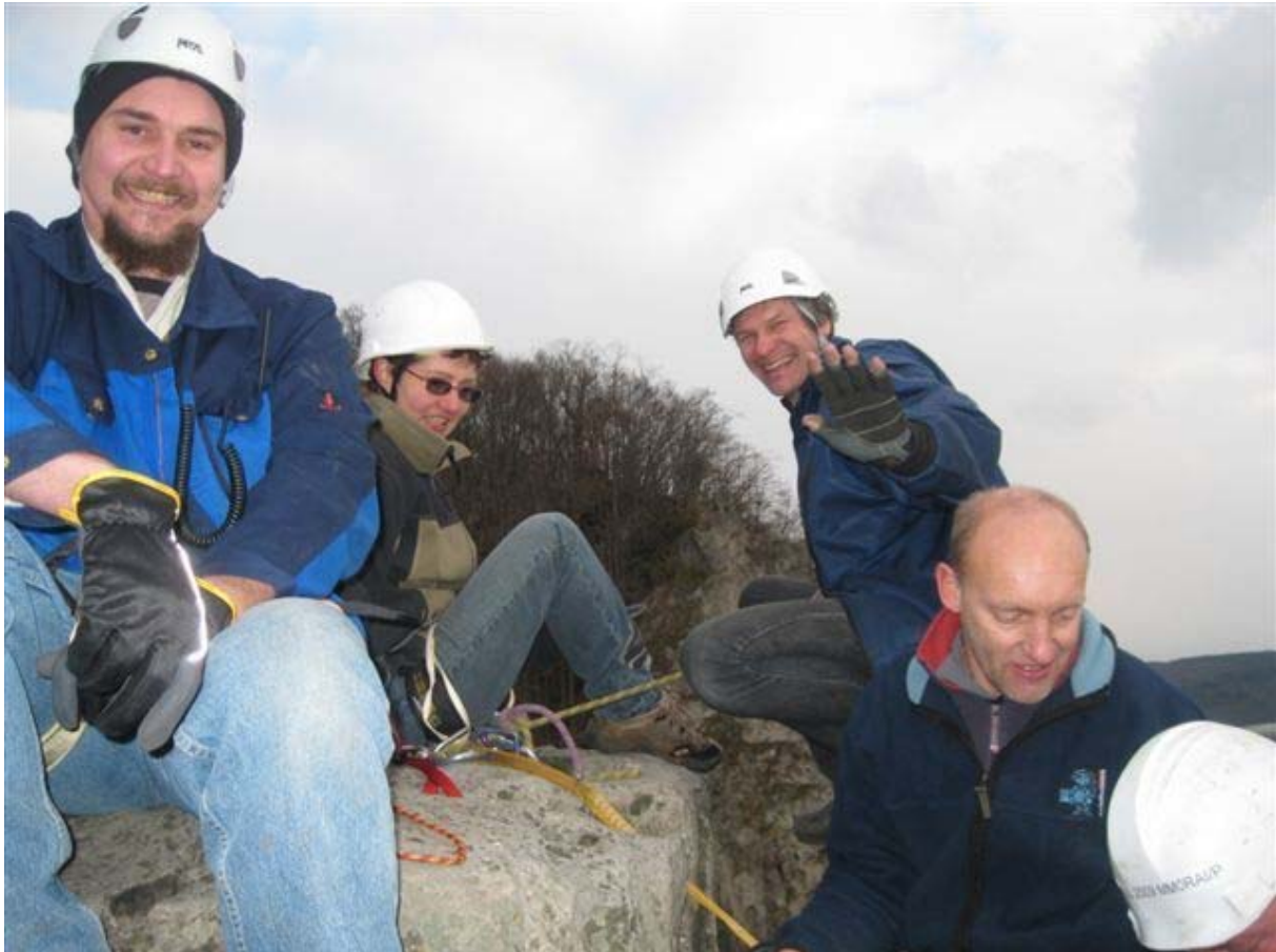
Rotsklimmen als voorbereiding: ON5TN, ON6ZU, ON4HIL en de berggids.

zo de operatie niet in gevaar te brengen. Van toen af werd er actief gezocht naar eventuele sponsors voor financiële en praktische ondersteuning. Er werd een donatielink op de site geplaatst en online kon je allerhande gadgets kopen zoals T-shirts, jassen en tassen. De site werd druk bezocht en we kregen positieve reacties uit heel de wereld. Dit stimuleerde ons nog meer om de expeditie tot een succesvol einde te brengen. Waar het meeste naar werd gekeken op onze site waren de filmpjes van de voorbereidingen van het team. Zo kon iedereen zien dat we echt wel voorbereid waren voor deze missie.