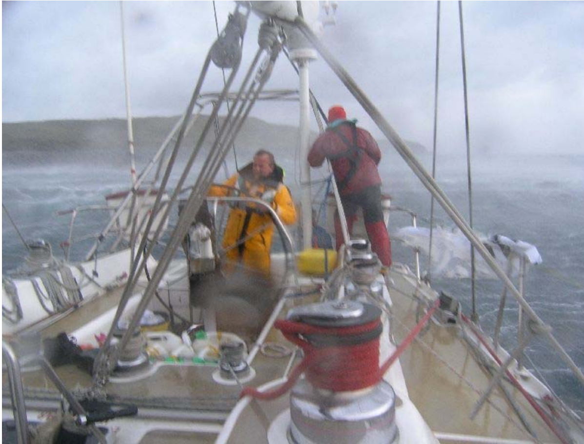
De Elinca bij storm (5 Beaufort).