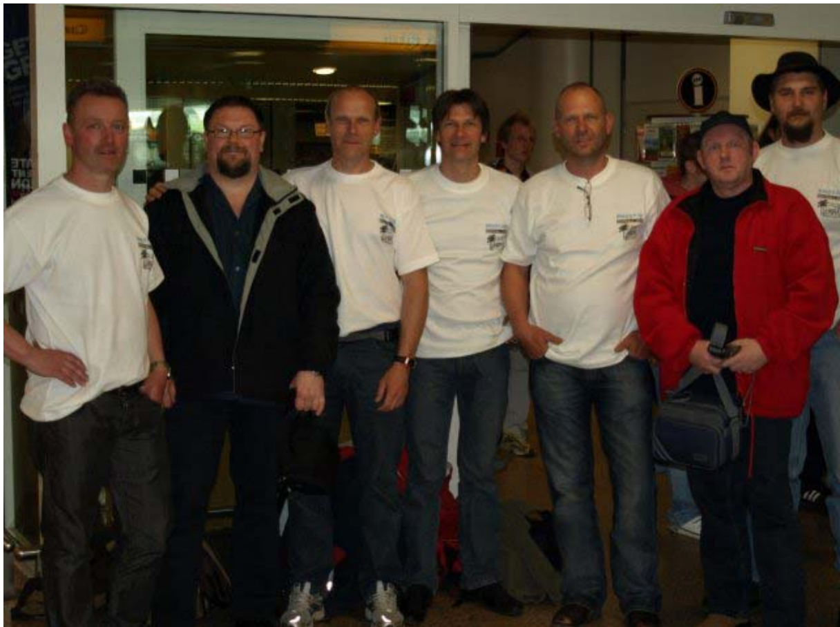
ON6CC, MM0GHM, ON4ATW, ON4HIL, ON4IA, MM3DHL et ON5TN.

Le mercredi 6 mai, le reste du groupe a repris la direction de la Belgique. Ce fut un voyage éprouvant mais au combien enrichissant pour tous. Nous avons beaucoup appris de ce voyage et peut être une nouvelle énergie s'est dégagée de cette malheureuse expérience qui nous autorisera peut être à entreprendre une seconde tentative sur Rockall. Nous recherchons activement pour ce faire tout sponsor car il en résulte un risque financier pour tous les membres de notre équipe. Nous avons à cœur de réussir notre objectif tant pour nos futurs sponsors que pour la communauté radioamateur. Si vous désirez nous soutenir financièrement, prenez contact avec nous via info@rockall.be . Les photos et des informations supplémentaires sont à disposition sur www.rockall.be .