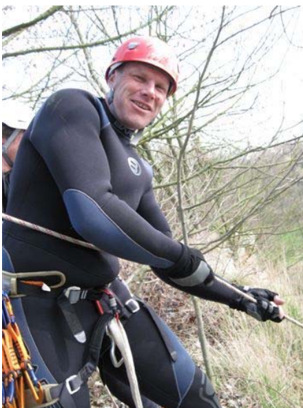
ON4ATW lors d'un exercice à Dongelberg.