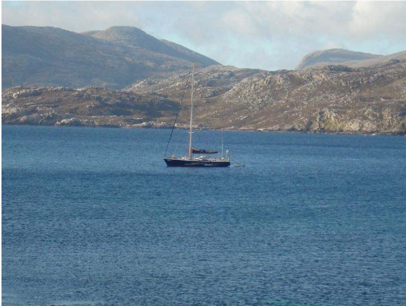
L'Elinca à l'encrage dans une des nombreuses baies de l'île Lewis.