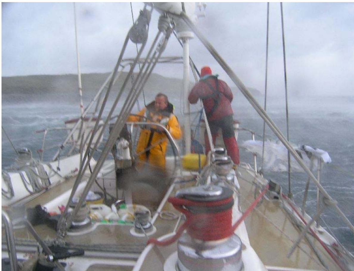
L'Elinca au milieu de la tempête (5 Beaufort).